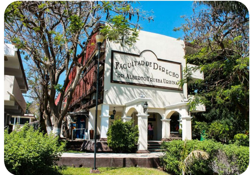
Fachada actual de nuestra Facultad de Derecho